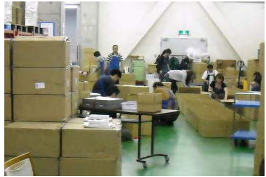
一般の作業員と現場で箱づくり作業を行う

仕事の受注は、支援員を窓口とし、作業工程や数量の把握を確実なものとししました。この窓口役の支援員が取りまとめていたことが、後々までもよかった点であり、企業からの受注体制が、確立されていきました。