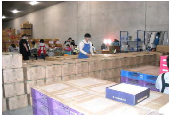
○東扇島 B 棟での作業現場