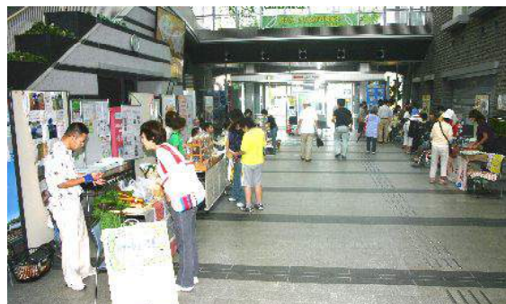
入り口の通路に沿って出店をする