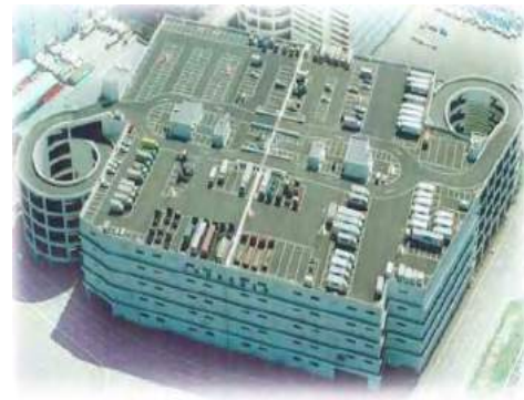
川崎市川崎区東扇島 15