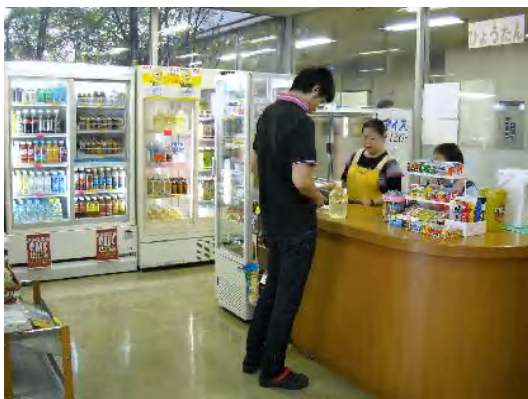
明るい表情で接客作業にはげむ

平成 18 年 10 月、SRC 内の売店運営を開始。形式は市作連受託ではありますが、作業に参加していたひとつの作業所が運営の主体となり、他の作業所等の障害者も含め販売、接客を行う体験の新たな広がりとなり、多種多様な仕事（職域）への発展となっていきました。