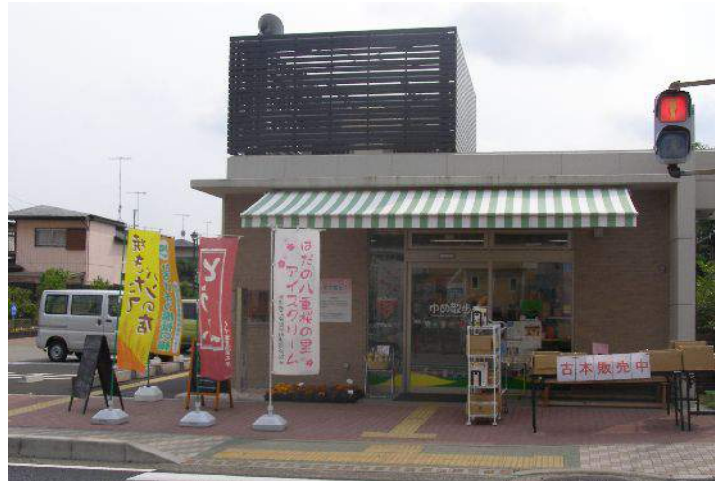
秦野駅から徒歩10分

自主製品等の販売 障害者の就労支援 障害者施設の運営相談 共同受注及び販路開拓 障害者に関する情報提供 研修事業等