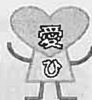
第1回生の作品「ヒューマン君」

A:入学料は、神奈川県内在住の方は70,100円、県外在住の方は140,200円です。授業料は、選択する科目・時間数により20,300円(100時間まで)～40,700円(101～200時間まで)となります。 ※2020年度生の金額(税込み)です。