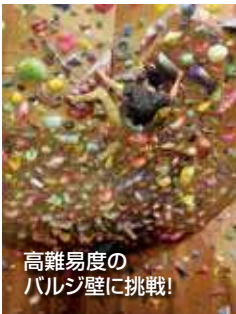
高難易度のボルダリング壁に挑戦!

また、ジム以外の場所でも野外で自然の崖などを登る「ロッククライミング」にも挑戦し、奥多摩などの自然あふれる場所でも楽しんでいきます。時には自然にできた不規則な岩に苔が生えていたり、蜘蛛の巣を乗り越えて登ったりとスリルを楽しみながら登り切り、大自然に囲まれた美味しい空気を吸いながら見える景色はいつもの何倍にも絶景に感じられます。コロナ禍でなかなか人と触れ合えて楽しめる機会が減っていますが、ぜひ一度、一人でも楽しめるボルダリングに挑戦してみたいかがでしょうか。