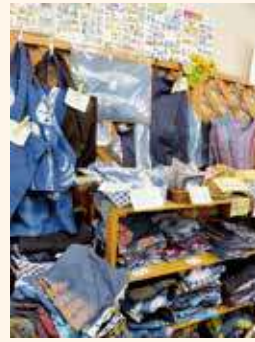
▼オシャレな藍染の商品

JR・東急武蔵小杉駅より徒歩3分の駅近で営業する夢屋は100種類以上のオリジナルデザインがかわいい手作りタオルなどの布製品や1枚ずつ手縫いで模様を入れ、絞り藍で染めた個性的な藍染製品などを販売しています。